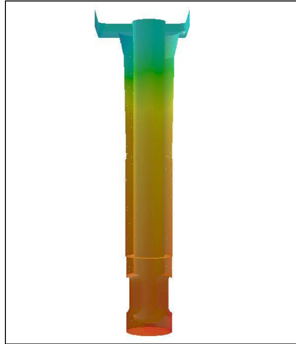
Abb. 2: Erzieltes Temperaturprofil des Tauchrohres.

Beim dritten Aggregat, dem Ofen zur Vorwärmung der Tauchrohre für den Strangguss, wurde die Ofengeometrie in fünf Schritten adaptiert, damit mittels gezielter Strömungsführung ein gewünschtes Temperaturprofil erreicht wird. Die Adaptierung der Geometrie erfolgte auf Basis eines stationären Modells, die finalen Rechnungen wurden transient durchgeführt. Die Evaluierung des Modells erfolgte anhand des Aufheizverhaltens eines mit mehreren Thermoelementen bestückten Tauchrohres.